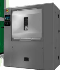
Barreras sanitarias 16-22 kg Elegible con ECOTANK 27-100 kg Elegible con ECOTANK XL