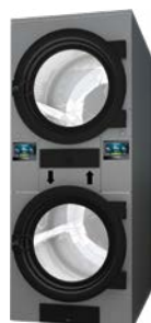
Doble tambor 11, 14, 18, 22 kg

Descubre nuestra completa gama de secadoras industriales, con modelos de un tambor, doble o bomba de calor , adaptables a tus necesidades y con opciones personalizables, como puertas de guillotina (45-80 kg en modelos específicos), y tecnología avanzada, garantizan eficiencia y conectividad para optimizar procesos y mejorar el control de tu negocio.