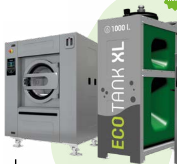
Lavadoras 35-120 kg (alta velocidad) Elegible con ECOTANK XL 35-80 kg (baja velocidad) Elegible con ECOTANK XL