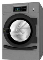
Secadoras HPD 8 - 10 kg