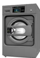
Lavadoras HPW 8 - 10 kg

Son equipos pequeños, robustos, eficientes y extremadamente versátiles, con las mismas altas prestaciones en eficiencia y productividad que la gama industrial, todo con una excelente relación calidad-precio.