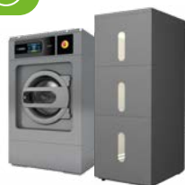
Lavadoras 11-28 kg (alta y baja velocidad) Elegible con ECOTANK

Además, ahorra hasta un 70% de agua con los depósitos ECOTANK y el nuevo ECOTANK XL .