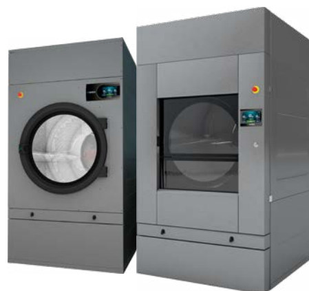
Un tambor De 11 a 80 kg